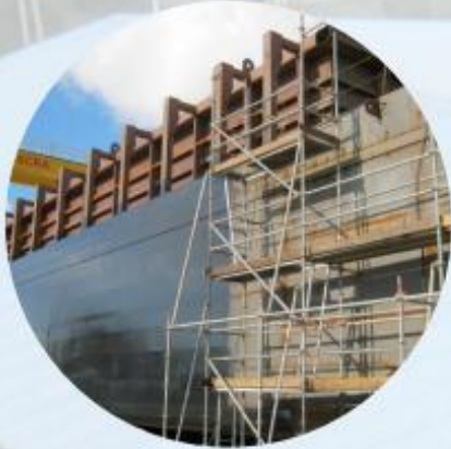
BARCAZA MONTES DEL PLATA