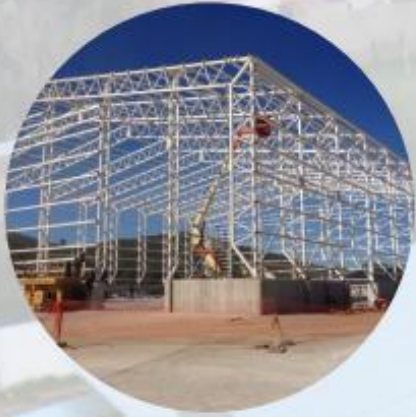
GALPON DE CARBON. ANCAP - MINAS