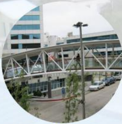
PUENTE MONTEVIDEO SHOPPING CENTER - WTC