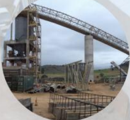
PLANTA DE CEMENTO ANCAP - MINAS