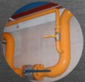
CAÑERÍA GAS MEDICA URUGUAYA