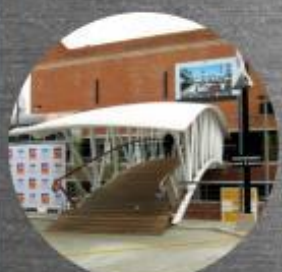
PUNTE MONTEVIDEO SHOPPING CENTER - WTC